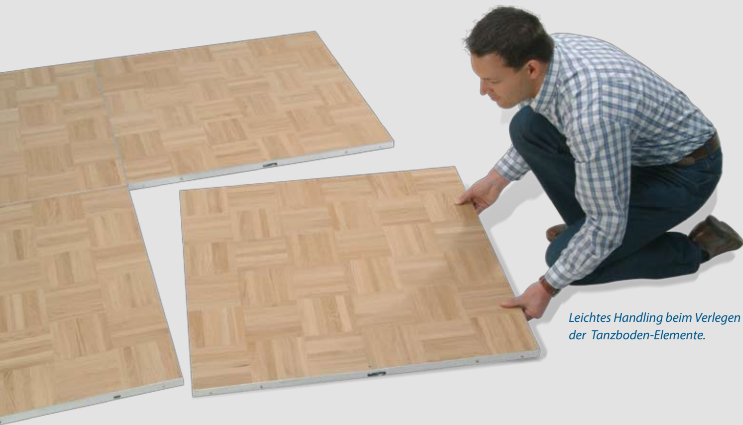
Leichtes Handling beim Verlegen der Tanzboden-Elemente.

Unsere mobilen Tanzflächen bewähren sich seit vielen Jahren auf der ganzen Welt. Im Handumdrehen können Sie in Ihrem Saal oder in Ihrer Festhalle rauschende Ballnächte veranstalten. Somit ist die mobile Tanzfläche ein zusätzlicher Umsatz-Motor.