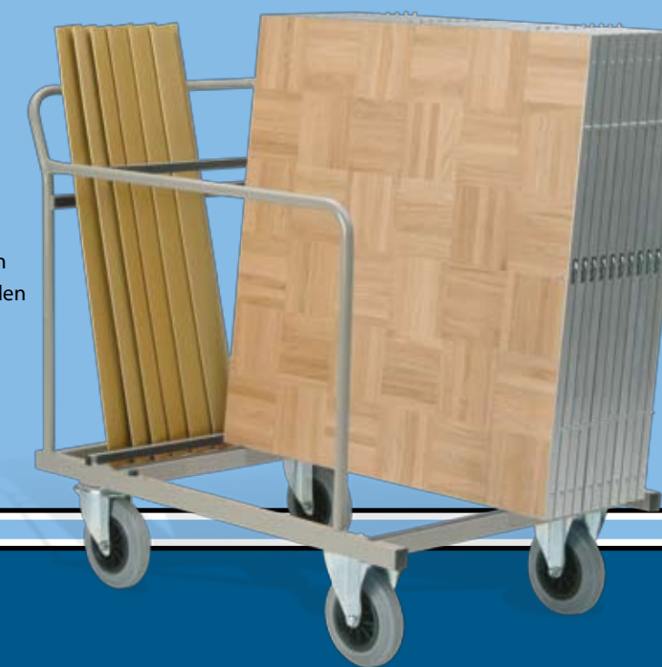
Platzsparende und übersichtliche Lagerung auf dem stabilen Transportwagen.

Ihre Tanzflächen-Elemente lagern und transportieren Sie praktisch im dazugehörigen Wagen. Platz ist für maximal 25 Elemente mit den dazugehörigen Umrandungsprofilen. Größe: 112 x 77 x 110 cm (L x B x H)