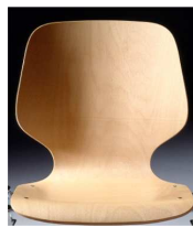
Schale Typ A