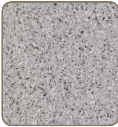
Speckled Grey Thermopal